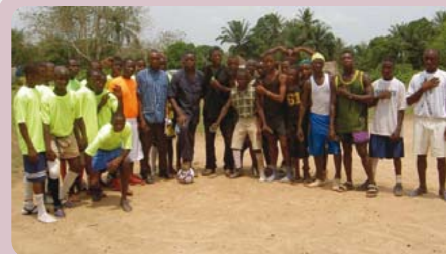
Fodboldholdet fra 8. klasse i Kangahun sammen med deres fan-gruppe og træner. Udeholdet fra nabobyen Mokpakpayebe var ikke nået frem, da billedet blev taget. Der bliver spillet på en grusbane og i al slags fodtøj.