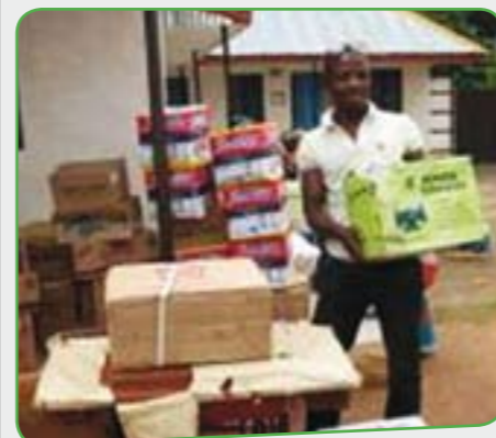
Både kristne og muslimer har fået hjælp.